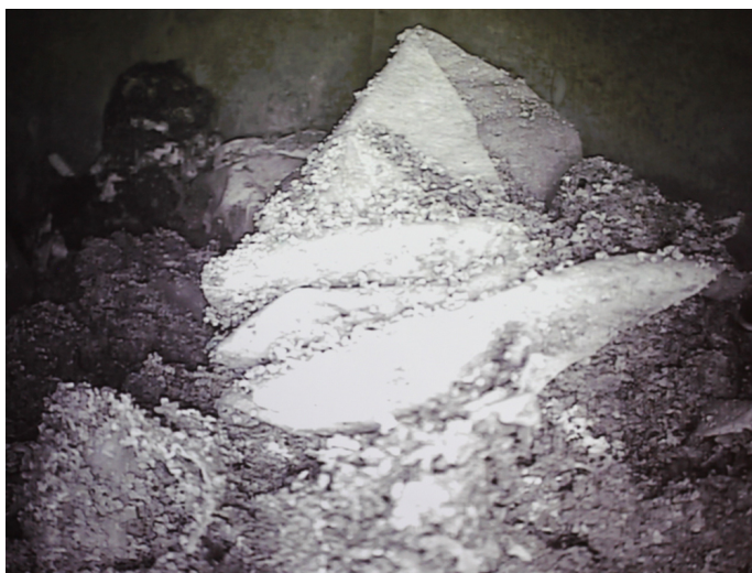
Stillbilde fra Makkverk, som vises på blackboxens bakvegg.

Bakkeslett viser meitemarkens aktivitet på blackboxens bakvegg som en live performance samtidig som hun forsterker støyen av meitemarkenes sakte travelhet via høgtalere i rommet. En prosess som skjer rett under beina på oss blir plutselig avdekket og presentert for publikum.