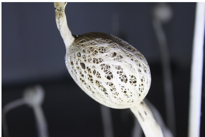
Detaljbilde fra knollskjelettskogen.