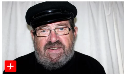
– For å være helt ærlig, så har jeg noen ganger dratt en hvit løgn, jeg også (/sondagspreken/22.01-10:59)