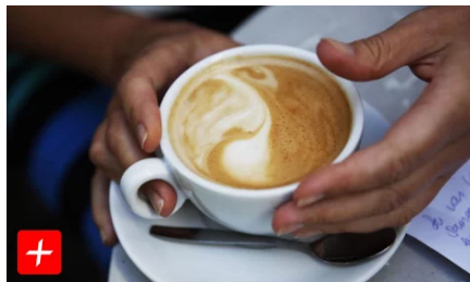
Sannheten om kaffe (/sannheten-om-kaffe/19.01-06:43)