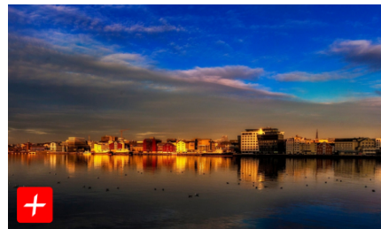
– Sannheten er at Bodø er en gørrkjedelig by som folk i det lengste vegrer seg for å dra til (/sannheten-er-at-bodo-er-en-gorrkjedelig-by-som-folk-i-det-lengste-vegrer-seg-for-a-dra-til/09.01-04:07)