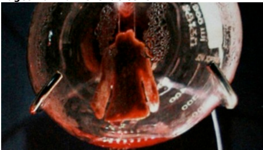
Musefrakk av levende celler